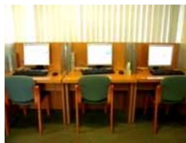
イ ン タ ー ネット コ ー ナ ー

DVDコーナー、インターネットコーナーとも、申込方法などは今までと変わりませんが、ご不明な点がありましたらカウンターの職員に質問してください。みなさまのご利用を心からお待ちしています。