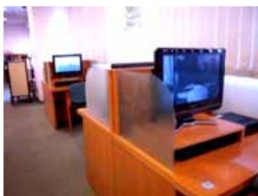
D V D コ ー ナ ー

DVDプレイヤーの使い方は、家庭にあるものとほとんど同じです。DVDを入れると再生が始まるので、その後の操作はカウンターで渡されるリモコンを使ってください。利用が終わりましたら、DVDを取り出し、リモコンやヘッドホンといっしょにカウンターへ返してください。座席は、横一列の配置から対面型に変わりましたので、落ち着いて鑑賞できるようになりました。DVDコーナーは4席ありますので、お気軽にご利用ください。