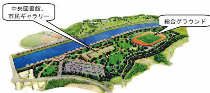
中央図書館・市民ギャラリー、総合グラウンドの整備イメージ

八千代市では、新川を中心とした社会資本整備総合交付金(まちづくり交付金)を活用した「八千代市中央図書館・市民ギャラリー整備事業」を第4次総合計画に位置付けし、5か年計画で事業を進めていきます。