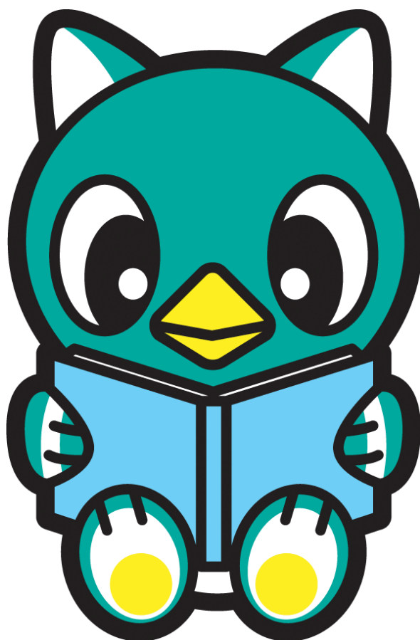
八千代市イメージキャラクター「やっち」